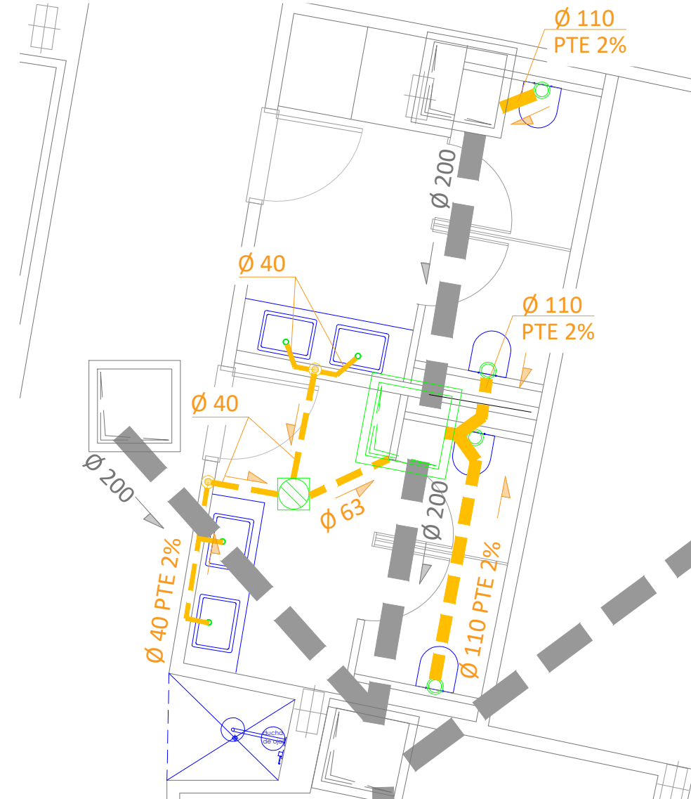
DETALLE SANEAMIENTO - ASEO esc: 1/50